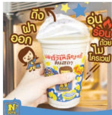
เครื่องดื่ม เอ็น โซย่า

(N SOYA) เครื่องดื่มนมถั่วเหลืองแท้ พาสเจอร์ไรซ์ คั้นสดด้วยกรรมวิธีดั้งเดิม คั้นน้ำเพียงครั้งเดียว ผลิตจากถั่วเหลืองคุณภาพ non GMO 100% ปราศจากวัตถุกันเสีย ไม่ผสมนมผง และน้ำมัน ถั่วเหลือง ไร้กาก บรรจุในแก้วพร้อมดื่มด้วยฝา Easy Peel นำแก้วเข้าอุ่นร้อนในไมโครเวฟได้หลังจากดึงฝาดอก จัดโปรโมชั่น นมถั่วเหลืองสูตรต้นตำรับ หวานน้อย ขนาด 350 มล. 16 บาท (ปกติ 18 บาท) ที่ 7-Eleven ทั่วประเทศ และ ปริมาณ และสาขาต่างๆ อีก 20 จังหวัด