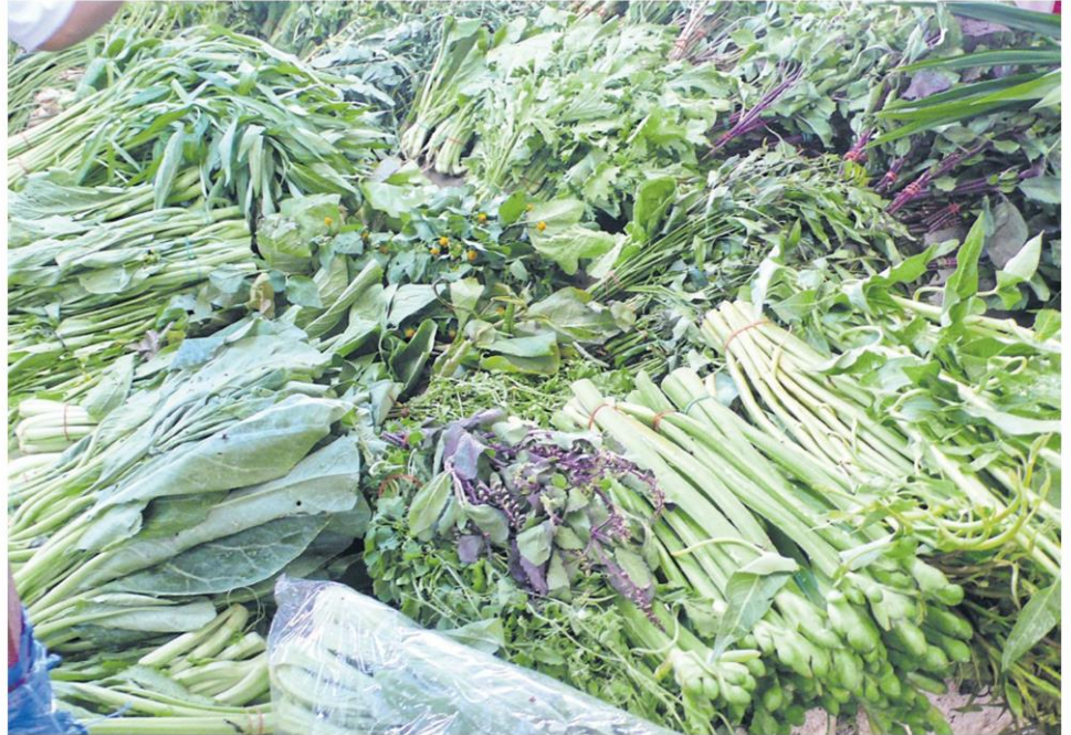
Produce at a fresh market.