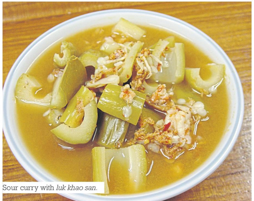
Sour curry with luk khao san .

Madan fruits are added in sai bua curry in coconut cream with steamed mackerel,