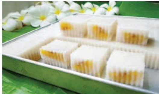
วุ้นกล้วยบวชชี-พร้าวอ่อน : บานา Banana International

●● 23 มิ.ย. ภัตตาคารอาหารจีน โฟร์ ซีซั่นส์ (Four Seasons Chinese Restaurant) จัดโปรโมชั่น Mid Year Special สั่งเมนูเปิดตัวอย่างรับประทานที่ร้าน ขนาดใดก็ได้ รับส่วนลด 30% ณ ชั้น G โซนซิโน ภูเก็ต ศูนย์การค้าจังซีลอน ป่าตอง ภูเก็ต 11.00-22.00 น. โทร.0 7636 6686