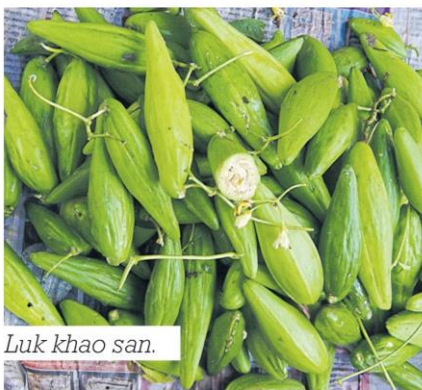
Luk khao san.