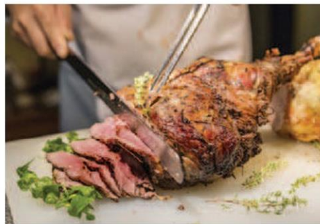
คาร์เวอริ์ ไก่ บุปไฟฟต์

ซอสครีมสูตรพิเศษ คู่ไวน์ขาว Beringer Founders' Estate Chardonnay ปี 2016, ปลาซามาจิ ไก่ตุ๋นมิโซะ เนื้อคาโชมะ เนื้อแกะย่าง ปูปรุงโดยเชฟ อัลวาโร โรอ์ (Alvaro Roa) ณ ห้องอาหาร อีฟ แอนด์ อะบัพ โรงแรม ดิ โอกูระ เพรสทีจ กรุงเทพฯ 18.30 น. 3,900++บาท/ท่าน สำรองที่นั่งและชำระเงินก่อนวันที่ 28 มิ.ย. ท่านละ 3,500++บาท โทร.0 2687 9000